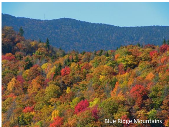
Blue Ridge Mountains