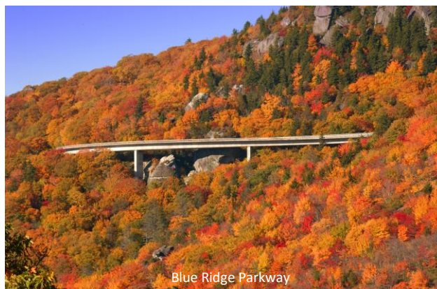
Blue Ridge Parkway