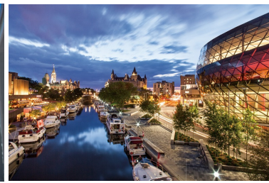
Rideau Canal, Ottawa